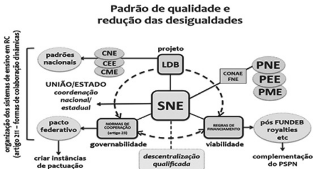
Figura 3 – Constituição e articulação do SNE com os planos de educação

Nesse sentido, o PNE, para os próximos dez anos, promoverá um grande avanço também nas questões democráticas, pois fixa obrigações de caráter federativo e estabelece prazos para a criação de leis específicas de gestão democrática que farão avançar a educação na oferta, na qualidade, na redução das desigualdades e na aprendizagem dos alunos. Contudo, não basta apenas criar mais uma lei. Transformar o PNE em um instrumento real de planejamento para o atingimento das