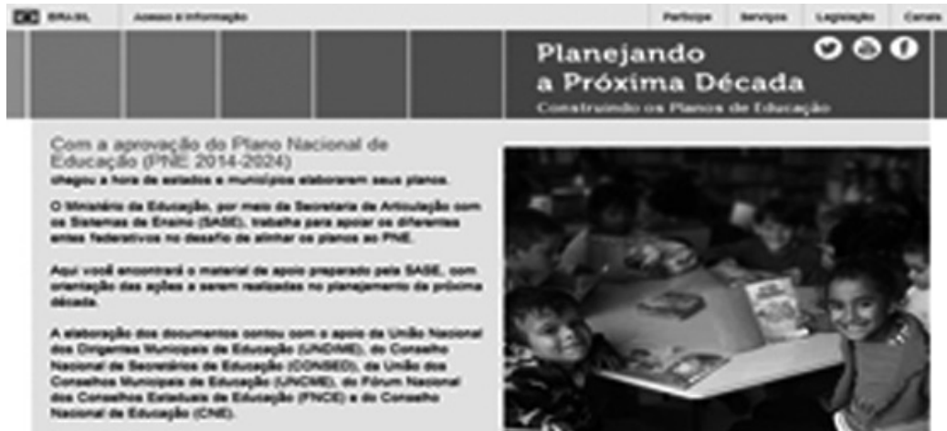
Figura 1 – Educação escolar no Brasil: Regime de Colaboração, PNE e SNE

Para tanto, é necessário ampliar os processos e mecanismos de atuação em regime de colaboração, visando ao alcance das metas e à implementação das estratégias objeto deste Plano. Caberá aos gestores federais, estaduais, municipais e do DF, em seu conjunto, a adoção das medidas governamentais necessárias ao alcance das metas previstas neste PNE. É preciso ampliar as ações de articulação e pensar estratégias que formalizem a cooperação entre os entes federados, podendo ser complementadas por mecanismos nacionais e locais de coordenação e colaboração recíproca.